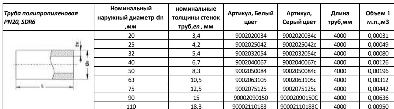
Таблица 5 – Сортамент труб напорных из полипропилена SDR 6 ( PN20 ).

3.5 Сортамент выпускаемой продукции указан в таблице 5.